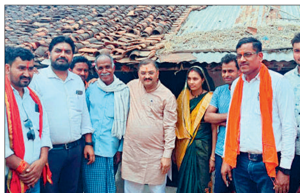
हरिभूमि न्यूज ►►कवर्धा

मुख्यमंत्री विष्णुदेव साय के मंशानुरूप जिले में प्रधानमंत्री आवास योजना ग्रामीण के तहत