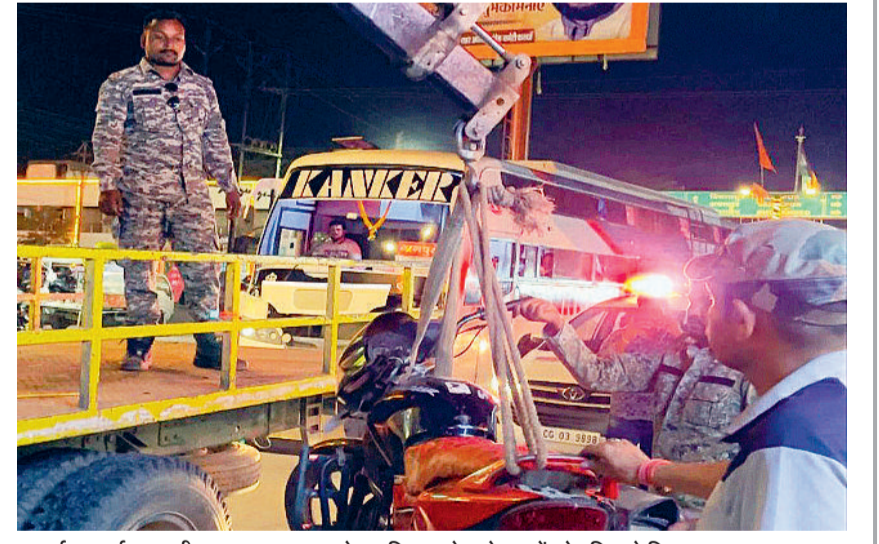
कवर्धा। कवर्धा नगर की यातायात व्यवस्था को प्रभावित करने वाले वाहनों को पुलिस ने किया जप्त।