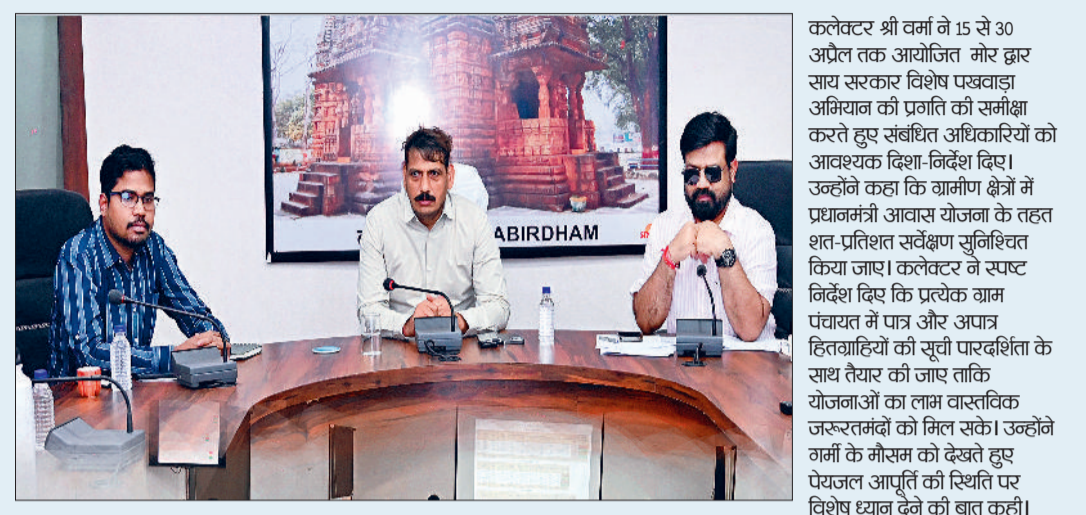
कलेक्टर ने निर्देशित किया कि सभी ग्राम पंचायतों, नगर पंचायतों एवं शहरी क्षेत्रों में पेयजल व्यवस्था सुनिश्चित की जाए तथा अधिकारी अलर्ट मोड में कार्य करें। उन्होंने कहा कि जिन गांवों या मोहल्लों में हैंडपंप या अन्य पेयजल स्रोत खराब हैं वहां सूचना मिलते ही तुरंत मरम्मत एवं सुधार कार्य प्रारंभ किया जाए। पेयजल संकट को हर हाल में टाला जाए। इसके लिए जनपद पंचायत के सीईओ, नगर पंचायत के सीएमओ, पीएचई विभाग के अधिकारी तथा तकनीकी अभियंताओं के बीच सम्बन्ध स्थापित कर त्वरित कार्यवाही सुनिश्चित करने के निर्देश दिए गए।

परिषद पर उचित वास्तविक विभागों में स्थानांतरित करने के निर्देश दिए। उन्होंने कहा कि सुशासन तिहार के अंतर्गत शिकायतों से संबंधित आवेदनों को बेहद गंभीरता से लेवें। निराकरण में संवेदनशीलता का परिचय दें। कलेक्टर ने कहा कि प्रतिदिन आवेदनों के अद्यतन स्थिति से अपडेट रहें। उन्होंने शिविर के पूर्व विभागों को प्राप्त सभी आवेदनों का परीक्षण कर निराकरण कर लेने के निर्देश दिए। बैठक में यह भी कहा कि विभागों को मिले सभी आवेदनों के निराकरण में गुणवत्ता का विशेष ध्यान रखें। किसी भी आवेदन को बिना परीक्षण किए बागैर अस्वीकृत नहीं करने के निर्देश दिए गए। कलेक्टर अधिकारियों को निर्देशित करते हुए कहा कि ऐसे आवेदक जिसका निराकरण किया जाना संभव न हो अथवा अपात्रता की श्रेणी में हो, ऐसे आवेदनों को अस्वीकृत करने संबंधी प्रमुख कारणों का उल्लेख करते हुए संबंधित आवेदन को अवगत कराया जाए।