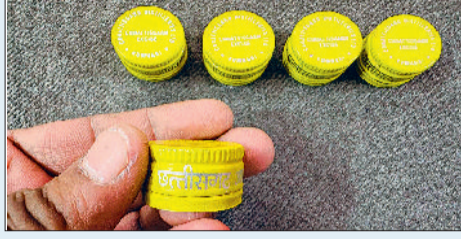
कैसे पहुंची करोड़ों रुपए की शराब

इस मामले में पुलिस ने पहले गौदिया के उस बंकर को पकड़ा था, जो आरोपियों को ढक्कन उपलब्ध करता था। इसके बाद ढक्कन बनाने वाला फैक्ट्री संचालक दिल्ली से गिरफ्तार किया गया। दिल्ली से जहां ढक्कन आ रहा था। वहीं शराब की खेप इंदौर से आई थी। हालांकि इंदौर से शराब भेजने वाले ठेकेदार को अब तक गिरफ्तार नहीं किया जा सका है।