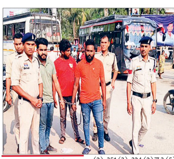
पुलिस प्रशासन की प्रभावी कार्यवाही, गए जेल