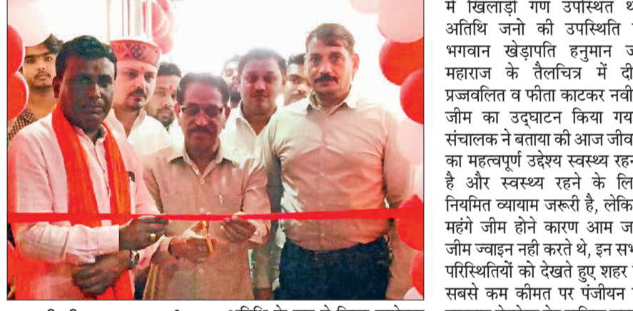
हरिभूमि न्यूज ▶▶कवर्धा