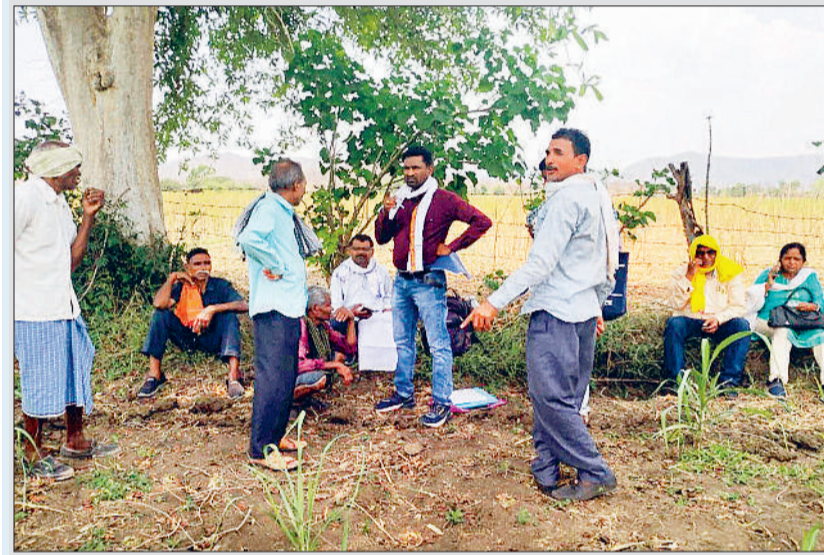
गांवों के खेतों तक पानी पहुंचा सकेगा और पानी की समस्या से राहत मिल सकेगी। उन्होंने बताया कि जैसे ही विवाद सुलझेगा, नहर निर्माण तेजी से पूरा किया जाएगा और क्षेत्र में पानी की किल्लत खत्म होगी। यदि नहर का निर्माण हो जाता है तो वहां के किसानों को पानी से राहत मिलेगी साथ-साथ रास्ता का एक विकल्प मिल जाएगा जिससे शक्कर कारखाना जाने में किसानों को आसानी होगी।

विस्तारीकरण की मांग की थी। राज्य सरकार ने किसानों की समस्या को देखते हुए करिया आमा से राम्हेपुर तक तीन किलो मीटर लंबी नहर निर्माण के लिए करोड़ों रुपए की राशि